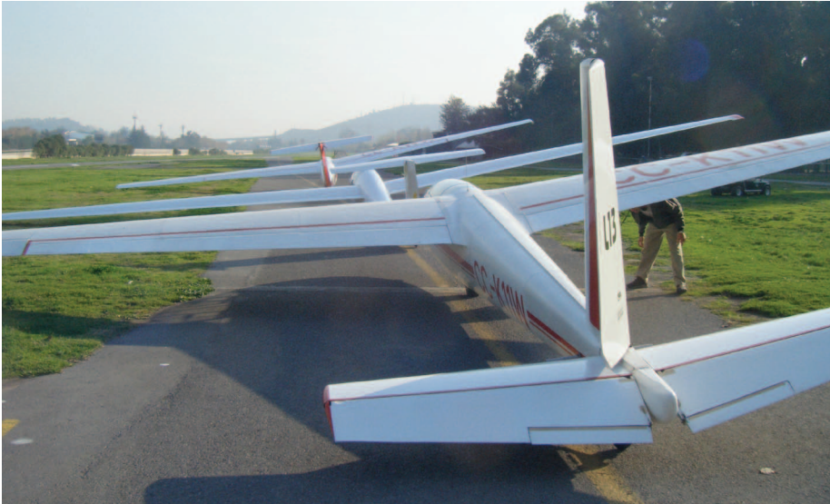
De Blanik aan de startlijn

Zoals de meesten onder jullie wel weten, reis ik beroepshalve heel regelmatig naar het buitenland. Af en toe geeft dit mij de mogelijkheid om elders te kunnen zweefvliegen. In het begin van dit jaar had ik zo een mogelijkheid in Chili.