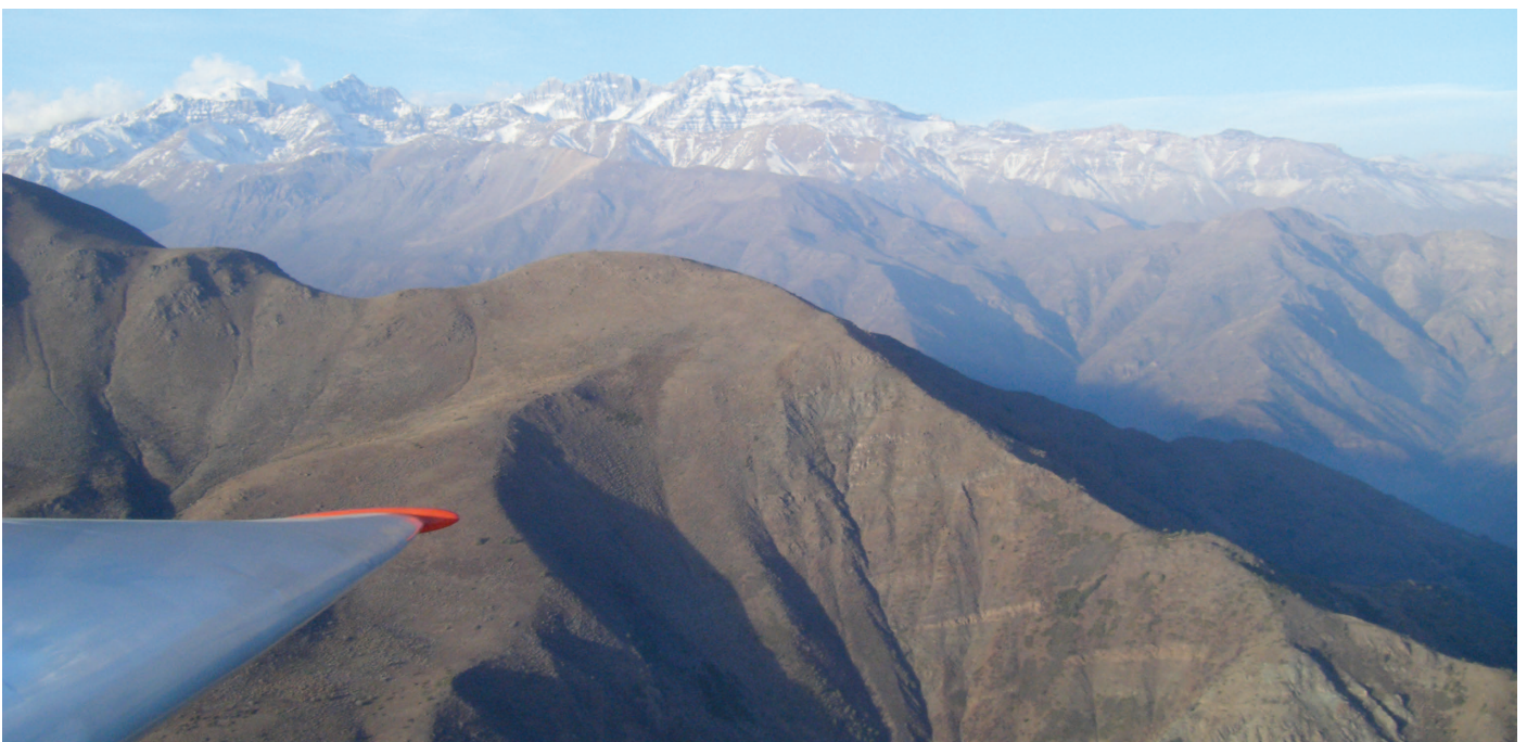
De piloot hield afstand tot de bergen...