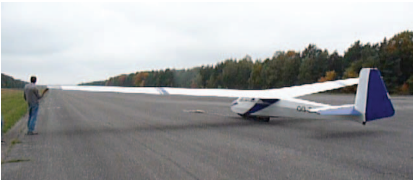
Een oude bekende: de OO-ZAE vliegt nu in Zutendaal...