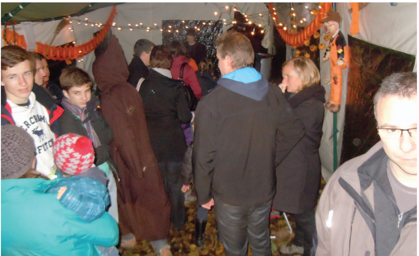
Gezellige drukte op het keerpunt