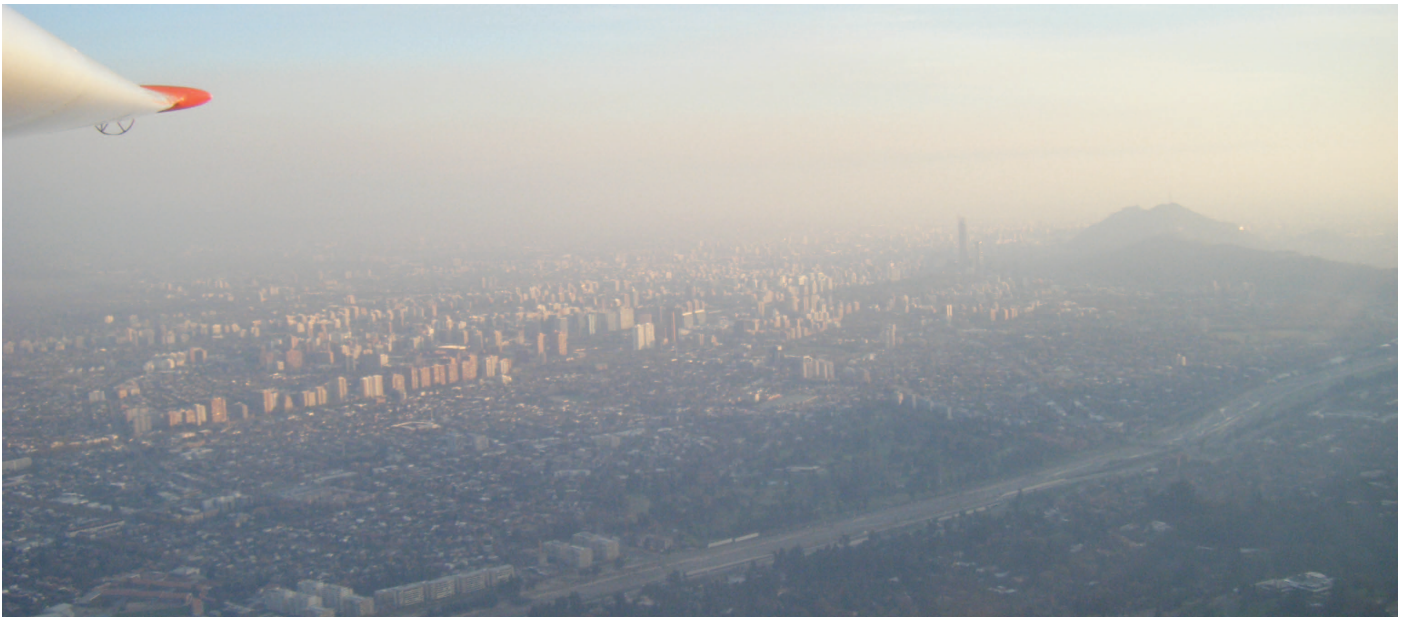
De lucht zag er wat mistig uit vanop de grond, maar in de lucht was het nog erger...