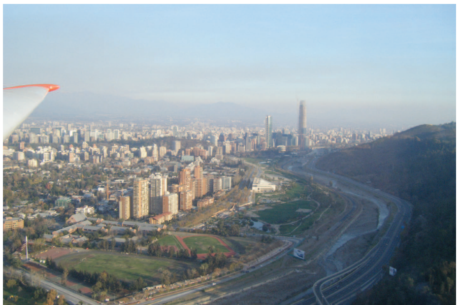
Het vliegveld ligt IN de hoofdstad...

Het weer was niet perfect, maar het was wel vliegbaar. Toch maar eens een kijkje gaan nemen, dacht ik dan. En inderdaad, reeds vanop afstand kon ik de zweefvliegers zien opgetrokken worden. Ik moet toegeven dat het een raar gevoel geeft om naar een zweefvliegveld te zoeken in het midden van de stad... Het ligt parallel met een autostrade, maar volledig omringd door woningen. Aangekomen, was het een kleine zoektocht naar iemand die Engels sprak. Toevallig kom ik een oudere man tegen die onmiddellijk merkte dat ik op zoek was naar iets. Toen hem uitlegde dat ik graag eens wou zweven, ging alles in een stroomversnelling. De sleeppiloot werd verwittigd, de Blanik in pist getrokken en ticket betaald. De piloot die mij zou meenemen, is een wedstrijd piloot en kent de bergen heel goed. Hij verwittigde mij reeds dat de kans zeer klein was om een lange vlucht te maken. Er was te weinig wind (klinkt cliché, hé) en geen thermiek. Een lange sleep leek dus wel opportuun. Na een tijd wachten kon-