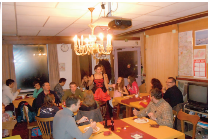
Na de tocht lekker smullen